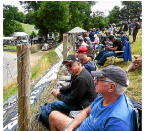
« Pour être aux premières loges au fer à cheval, il fallait arriver tôt.

Au total, 270 pilotes ont ravi le public, soit une vingtaine de plus que d'ordinaire. « On a été surpris d'accueillir autant de pilotes cette année, c'est une vraie réussite, qui souligne la qualité de l'organisation de l'événement », note Gilles Aignel, épaulé par 700 bénévoles présents à la restauration, pour les navettes qui conduisent les spectateurs sur le circuit, et pour la sécurité des pilotes. Un élément clef pour comprendre la réussite de la course de côte de Saint-Gouéno.