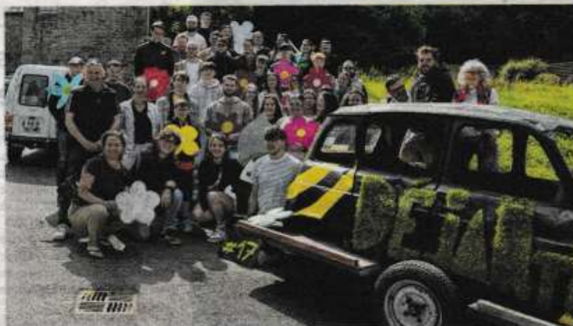
Le groupe de bénévoles du Déjanté pose derrière la fameuse 4L, spécialement sortie pour l'occasion, le 17 mai.

• Samedi 31 : une ambiance variée avec Talamh (folk), Mis-canthus Cie (un spectacle de danse tzigane, coloré et entraî-