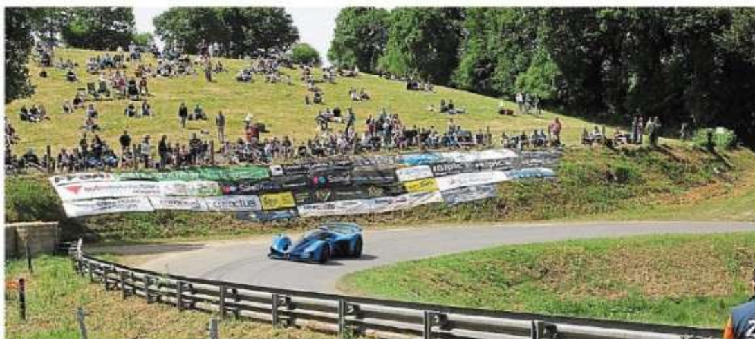
Parmi les différents modèles qui ont parcouru le circuit, les spectateurs ont pu admirer le modèle Delage « D12 ». Un véhicule rare et très onéreux, tout en carbone.