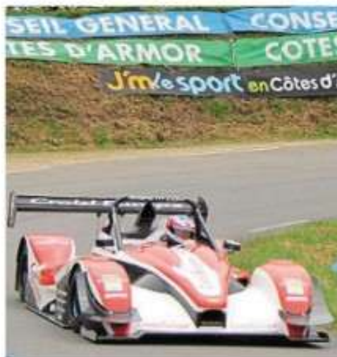
La 40 e édition de la Course de Côte de Saint-Gouéno aura lieu ce week-end.