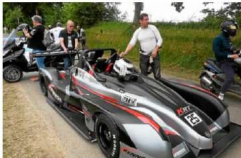
De sacrés bolides sont présents sur le circuit de Saint-Gouéno, avec des voitures qui ressemblent plus à des Formule 1 pour certaines qu'à des voitures de rallye.