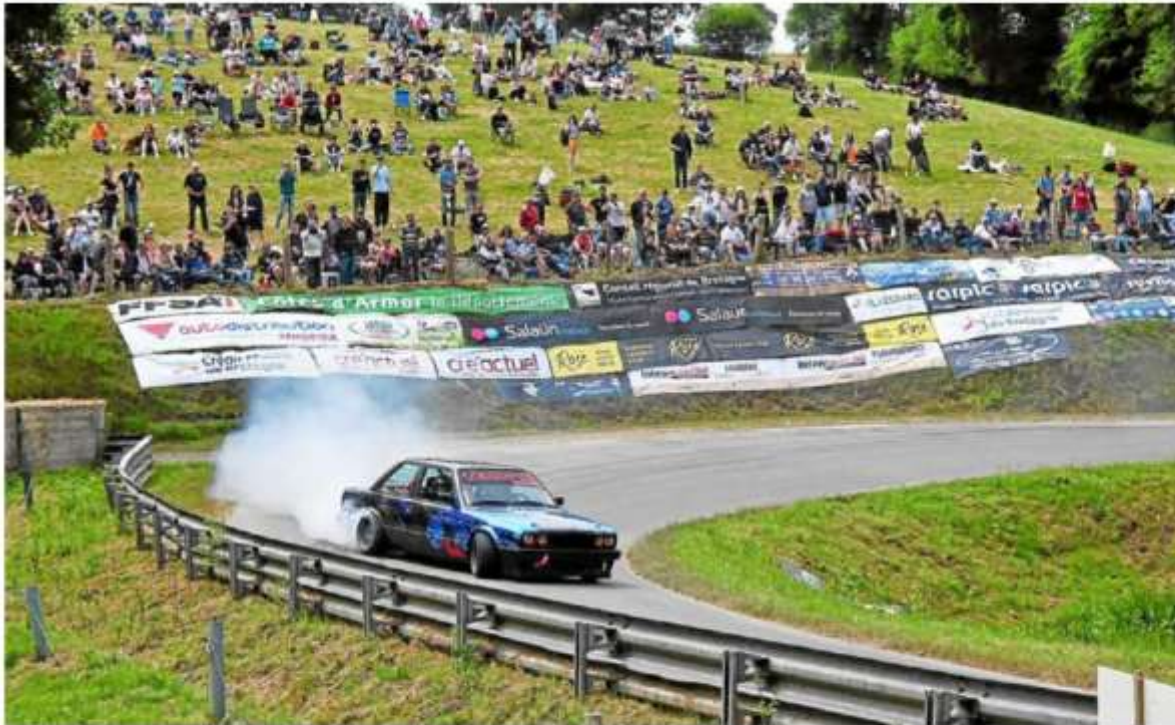
« Fumée blanche, le pape est élu, fumée bleue, la soupape est foutue », n'hésite pas à dire le speaker de la course. Le spectacle lui était bien là et le public, nombreux, a pu l'apprécier.