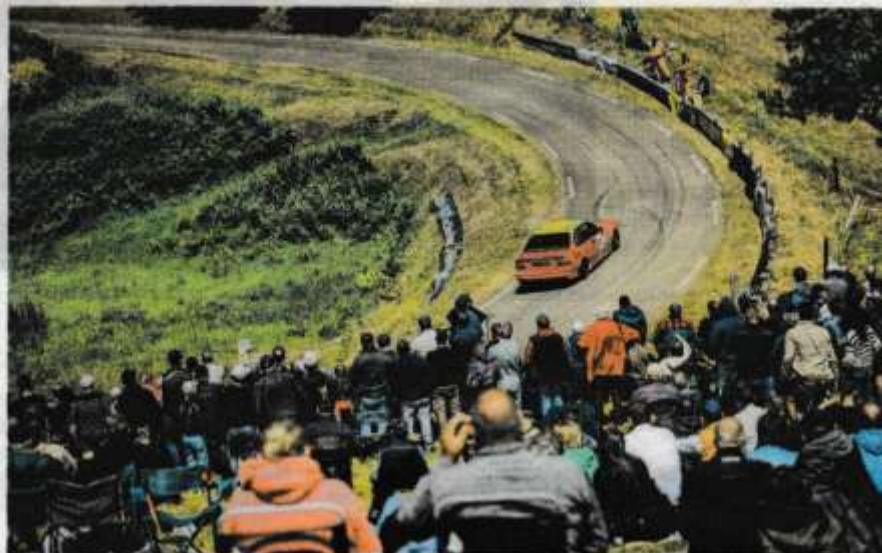
La 40 e édition de la Course de côte se court les 30, 31 mai et 1 er juin à Saint-Gouéno (Le Mené).

Côté animations, le programme s'annonce également chargé avec le « Festival Déjanté », les 29, 30 et 31 mai. Deux soirées sont organisées durant le week-end, vendredi soir et samedi soir, ce qui ne sera pas sans rappeler les heures de gloire