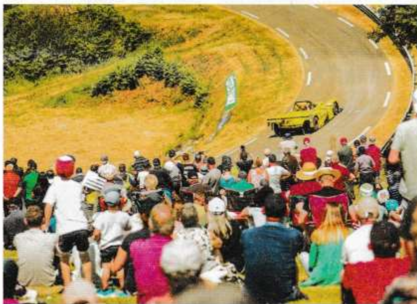
La course de côte ainsi que le festival Déjanté prendront place du 30 mai au 1er juin (photo d'archives).

Les amateurs de bolides pourront s'affronter du 30 mai au 1er juin sur la course de Côte de Saint-Goueno, qui fêtera ses 40 ans. L'événement, organisé par l'ASACO Maine Bretagne et l'Écurie du Mené, fait partie du Championnat de France de la Montagne 2025. Cette course est ouverte à tout véhicule sportif de plus de 30 ans et comptera pour le Championnat de France de la Montagne 1ère Division. Les participants ont jusqu'au jeudi 22 mai minuit pour s'engager sur la course.