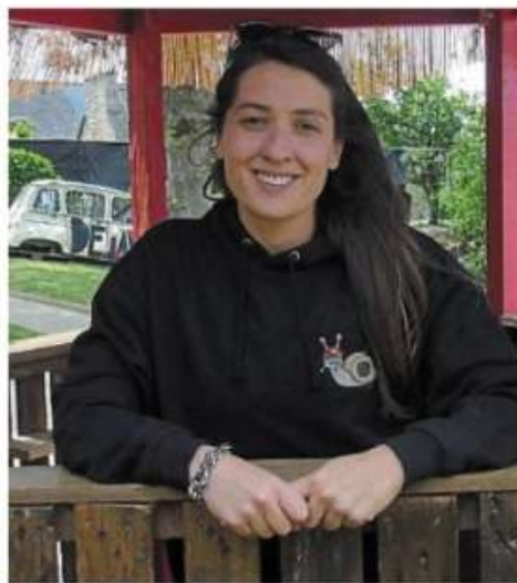
Le festival Déjanté a réuni 4 500 personnes, en 2022, selon Jeanne Carro.

La programmation est-elle toujours aussi rock ?