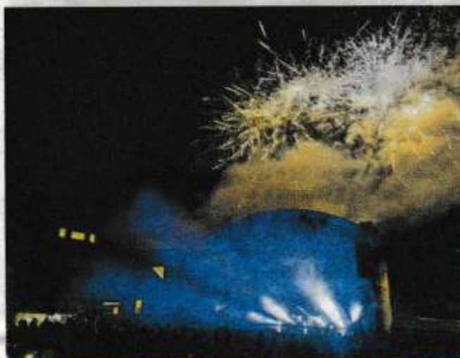
Un feu d'artifice a clôturé le festival. Festival Déjanté

Le week-end combiné entre Le Déjanté et la course de côte a attiré pas moins de 12 000 personnes, dont 5 000 festivaliers venus profiter des concerts et de l'ambiance unique sur trois jours.