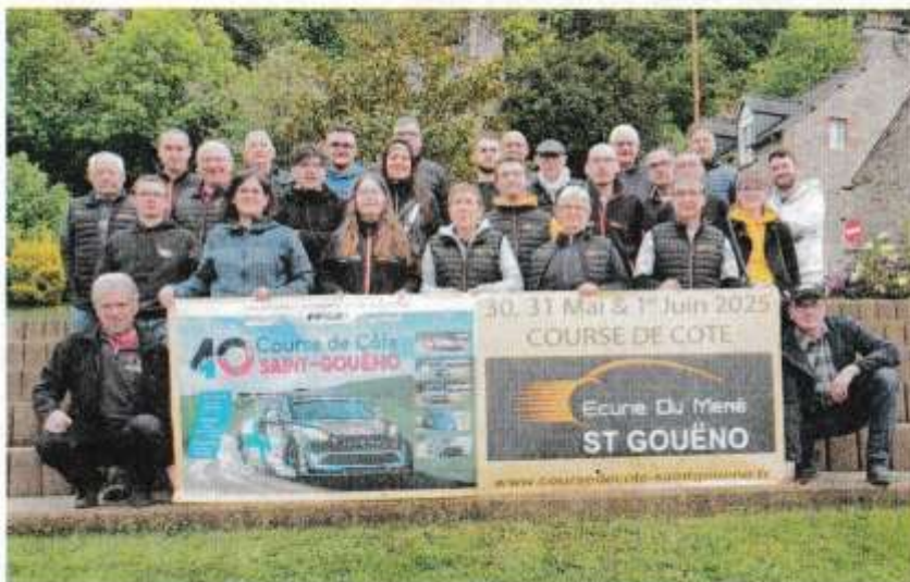
L'équipe est prête à accueillir le public.

Les amateurs de bolides pourront s'affronter du 30 mai au 1er juin sur la course de Côte de Saint-Gouëno, qui fêtera ses 40 ans. L'occasion d'accueillir une nouvelle fois, l'élite des Montagnards de France et de Navarre, mais aussi ceux d'Angleterre et d'Irlande.