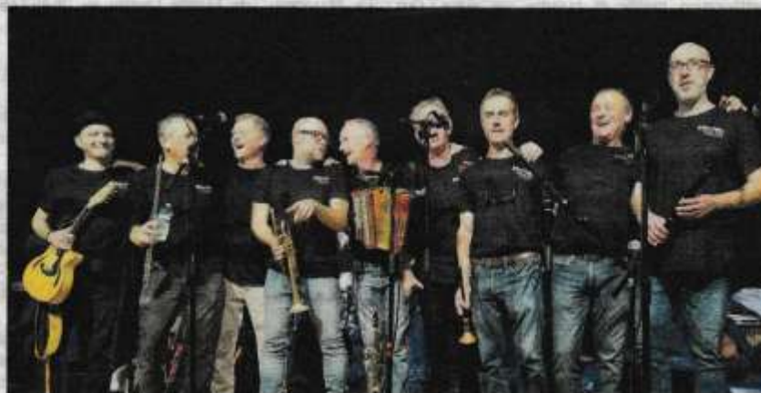
Le groupe Marialla, le local de l'étape.

• Vendredi 30 mai (12 €, gratuit pour les moins de 12 ans), déambulations et concerts du duo Toukan Tou-