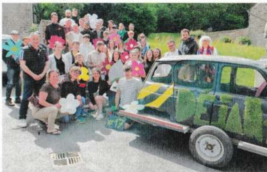
L'équipe organisatrice plus la mascotte du festival mise au vert.

Le 17 ème festival Déjanté des 29-30 et 31 mai prochains annonce une programmation éclectique, mais toujours aussi festive.