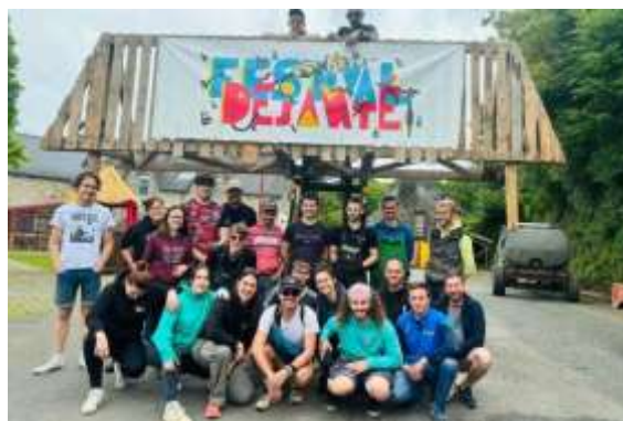
L'équipe du Déjanté 2024 sera à nouveau sur le pont.

Côté animations, le programme s'annonce également chargé avec le « Festival Déjanté », les 29, 30 et 31 mai 2025.