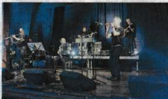
Marialla, un groupe du Mené, fera danser, jeudi soir.