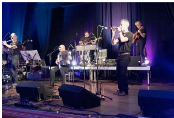
Marialla, un groupe du Mené, fera danser, jeudi soir.

Jeudi : fest-noz avec Marialla ; puis Los Bazos, trio de stars de la musique populaire bretonne et Régine Tonic.