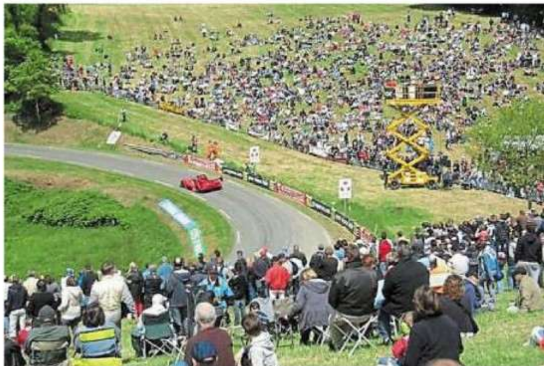
Chaque année depuis sa renaissance en 2003, la course de côte de Saint-Gouéno attire un public nombreux...