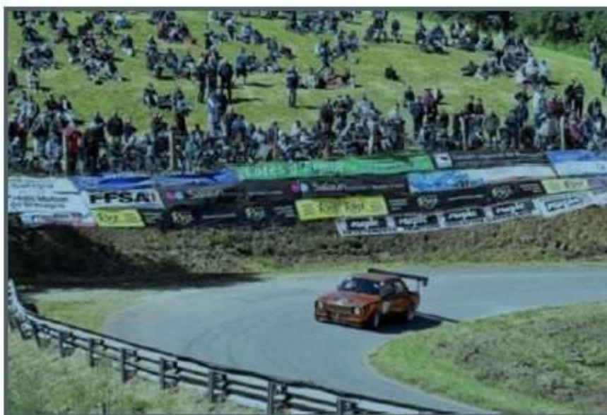
La course de côte de Saint-Gouéno promet du beau spectacle durant tout le week-end avec un public nombreux.

Pour ce week-end des 31 mai et 1 er juin qui s'annonce estival, il y a de quoi faire avec la course de côte et le festival Déjanté notamment à Saint-Gouéno, une exposition à Saint-Caradec ou encore la fête bretonne à Plumieux. Voici notre sélection.