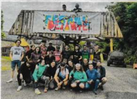
L'équipe du Déjanté 2024 sera à nouveau sur le pont.

■ Tarifs : vendredi 30 mai, gratuit; samedi 31 mai : 8 €; dimanche 1 er juin : 13 €. Forfait week-end (course + concerts) : 22 €. Gratuit pour les moins de 16 ans. Soirées-concerts : 12 € le vendredi, 12 € le samedi. Restauration rapide tout le week-end.